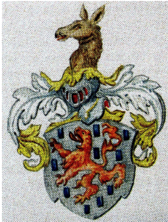
Autre blason de la famille Geroldseck

Dès lors, le Geroldseck devient un Ganerbenburg, un château possédé en commun par plusieurs copropriétaires dont l'évêque de Metz, les Lutzelstein, les Ochsenstein, les Wangen, les Lichtenberg... Les parts changent de mains et on compte jusqu'à 22 propriétaires ! La plupart se désintéressent de l'entretien du château qui connaîtra une série de « raccommodages » faits à la hâte et à l'économie. Le château ne peut plus assurer un rôle défensif adapté aux évolutions de l'artillerie.